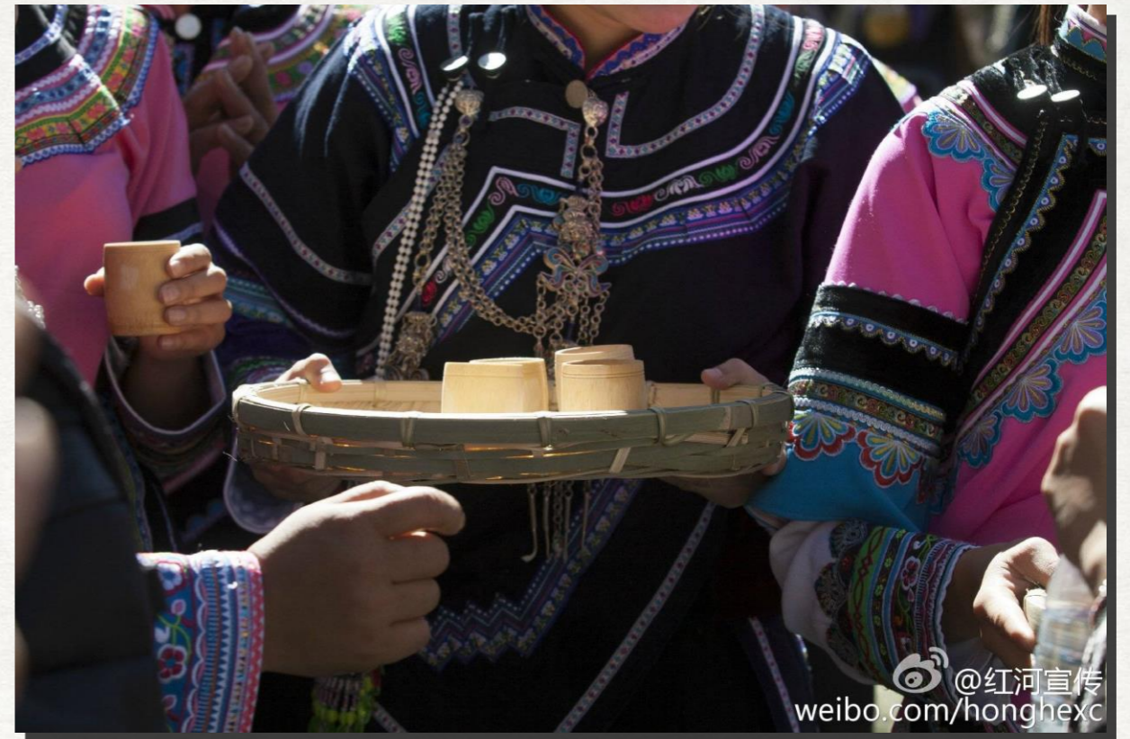
竹筒で作った酒杯