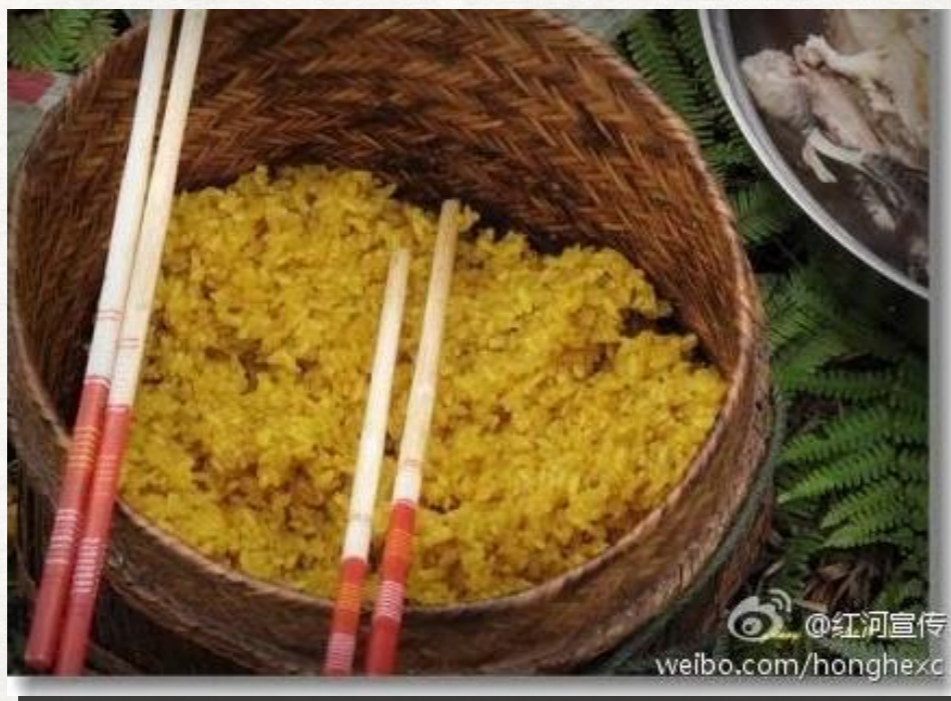
黄色に染めたもち米